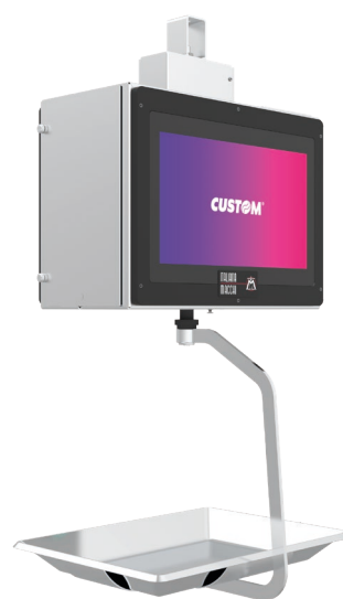
Vista lato cliente

Escluso palo di sostegno: da dimensionare in funzione dell'ambiente di lavoro